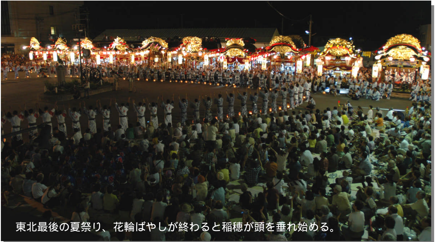
東北最後の夏祭り、花輪ばやしが終わると稲穂が頭を垂れ始める。